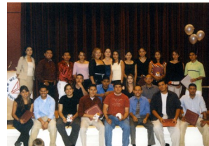
2003-2004 NMSU CAMP Graduates

A pesar de las dificultades que enfrentan nuestros estudiantes y el programa en sí, estoy convencida de que hemos ayudado a abrir puertas nunca antes imaginadas.