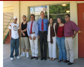
Estudiantes y el equipo de CAMP con el Sen. Jeff Bingaman durante su visita.

Después de escuchar los testimonios de los estudiantes y sus padres, el Senador Jeff Bingaman dijo que siempre ha estado a favor y ha apoyado la distribución de fondos a programas de educación al migrante. "Es apropiado que el gobierno federal tome cartas y ayude en este asunto, ya que muchas de estas familias se mudan tanto [y necesitan de este tipo de ayudas], " comentó el senador. "No cualquier comunidad puede con este tipo de compromiso."